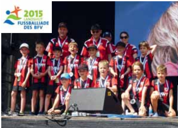
F1-Junioren-Siegerehrung auf der Show-Bühne in der Altstadt