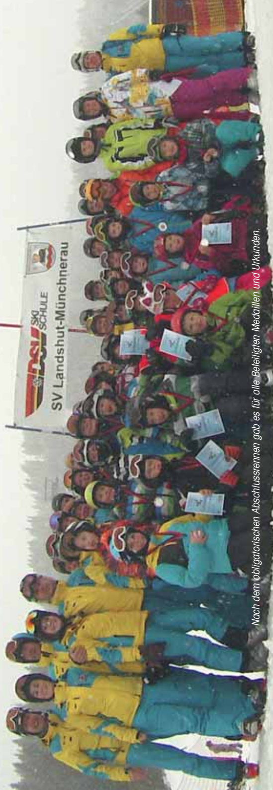
Nach dem obligatorischen Abschlusstest gab es für alle Beteiligten Medaillen und Urkunden.