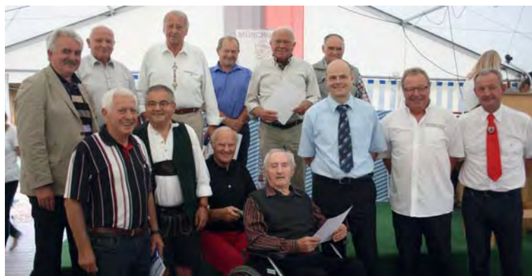
und unsere Gründungsmitglieder ausgezeichnet. (Alle Bilder des Ehrenabends finden Sie auf unserer Homepage: www.sv-landshut-muenchnerau.de )