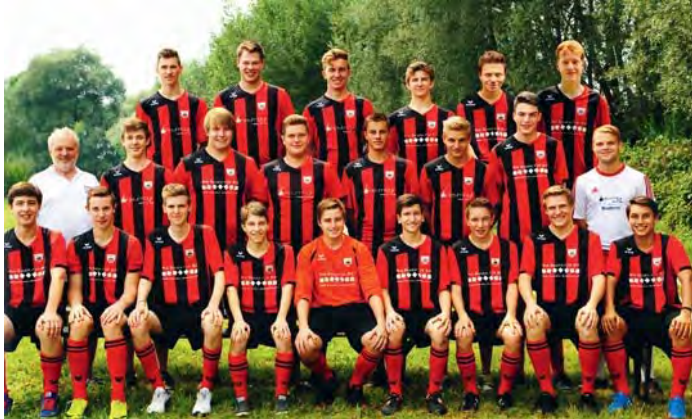
Die A-Junioren spielen in der Kreisklasse