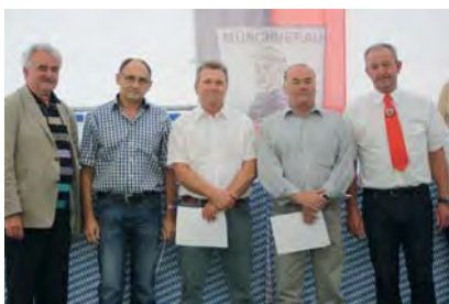
Fußballer aus den frühen Zeiten des SVM,