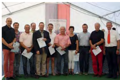
Unter anderem wurden unsere Skilehrer,