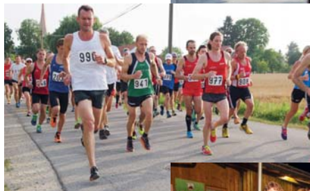
Start zum 10 km-Lauf