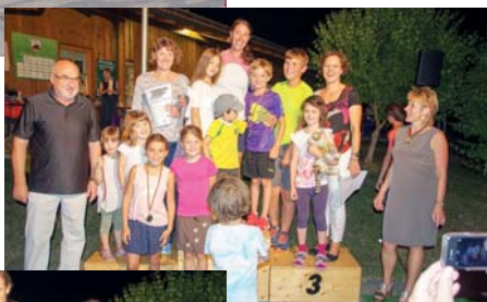
Der Platz auf dem Siegerpodest war heiß begehrt