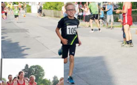
Zielankunft beim Kinderlauf